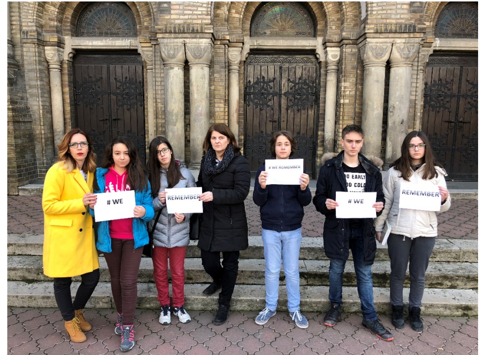
Deo akcije “We REMEMBER”

“Iza nas je ostalo još mnogo priča, ispred nas je još mnogo koraka i mogućnosti da saznamo da se sećamo i da poštujemo.”